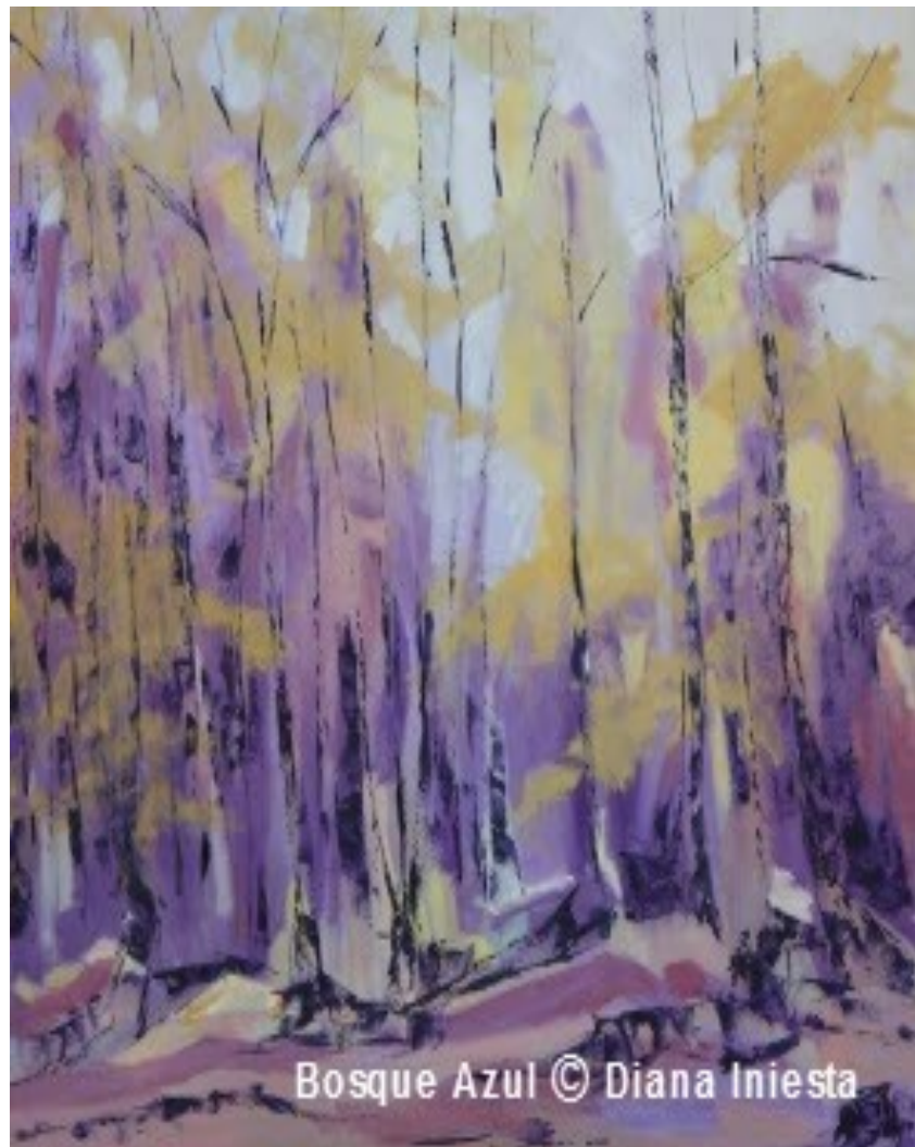
Bosque Azul