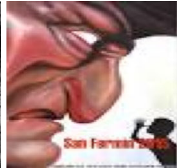
Cartel de San Fermín año 2015 Autor: Javier Erice

(las reproducciones que aparecen y que han sido obtenidas de internet, se introducen a modo de comentario crítico y para ilustrar el tema del plagio en el artículo doctrinal; cualquier reproducción, distribución, comunicación pública o transformación de la obra para fines comerciales necesitará autorización de los titulares de los derechos de propiedad intelectual).