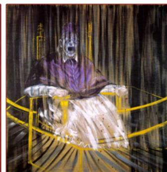
Retrato de Inocencio X (1953) Autor: Francis Bacon

(las reproducciones que aparecen y que han sido obtenidas de internet, se introducen a modo de comentario crítico y para ilustrar el tema del plagio en el artículo doctrinal; cualquier reproducción, distribución, comunicación pública o transformación de la obra para fines comerciales necesitará autorización de los titulares de los derechos de propiedad intelectual).