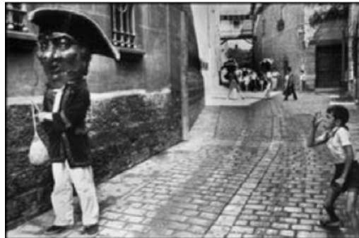
Obra fotográfica creada en 1973 Autor: koudelka

A continuación podemos ver dos imágenes ambientadas en las fiestas de San Fermín de Pamplona: