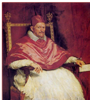
Retrato de Inocencio X (1650) Autor: Velázquez

En otros casos, el autor que copia imprime en su obra su propia personalidad y estilos creativos, por ejemplo, las dos reproducciones que se pueden ver a continuación, sobre las que el propio Bacon comentó que se inspiró en la obra de Velázquez: